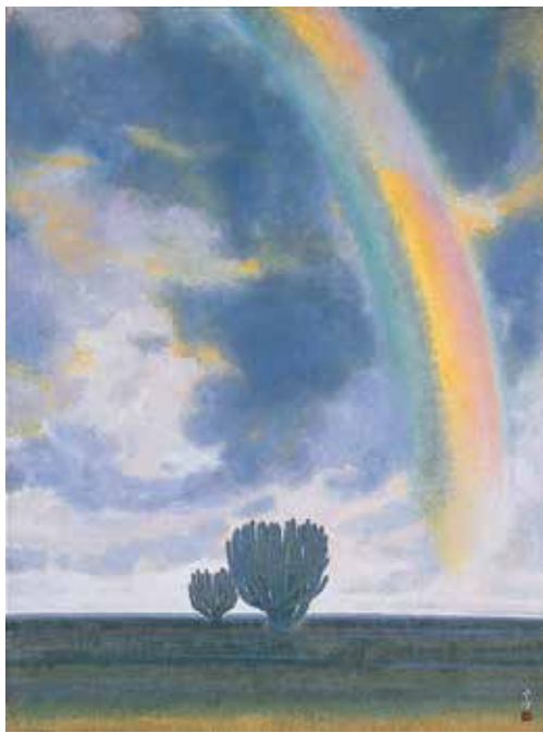
草原の虹 1981(昭和56) (改組) 第13回日展