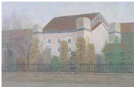
谷地小路風景 1950(昭和25) 第6回日展特選

日本画家 遠藤桑珠 (1917～2011 米沢市上郷出身) は昭和12年(1937)、20歳で中村岳陵に師事し、初期には院展に出品し頭角を現します。その後日展に移り、60年間日展を舞台に作品を発表しました。