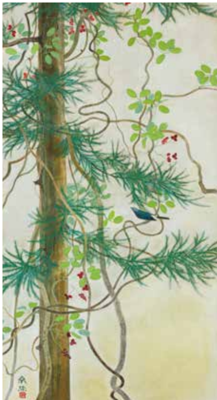
木通の頃 1946(昭和21) 再興第31回院展