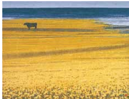
菜の花と海 1992(平成4) (改組) 第24回日展