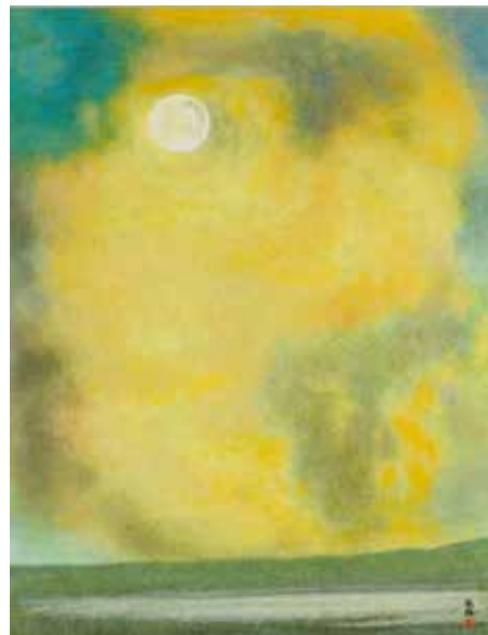
雲と草原 2005(平成17) (改組) 第37回日展